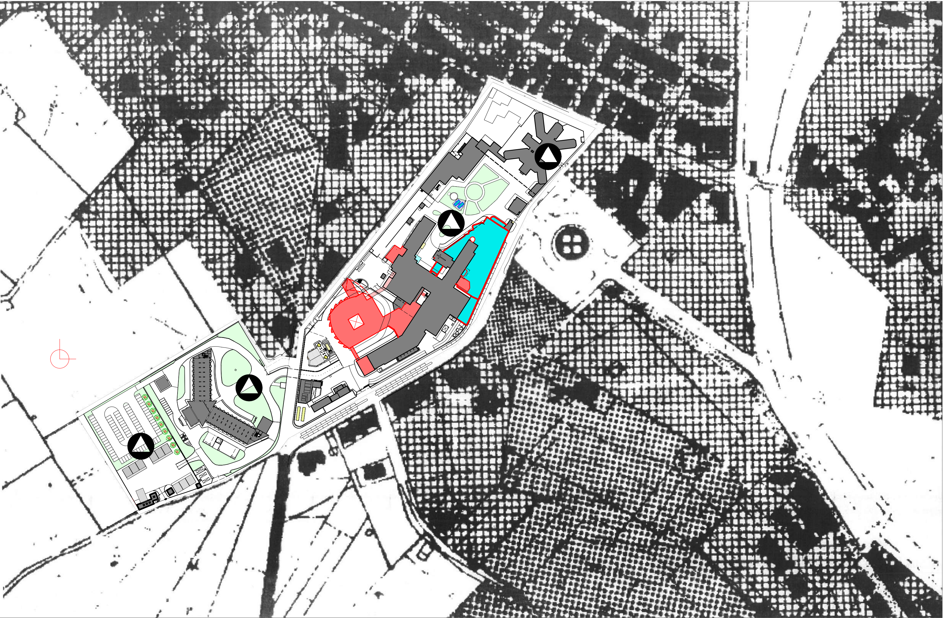
STRALCIO PROGRAMMA DI FABBRICAZIONE con inserimento variante "ZONA OSPEDALIERA"